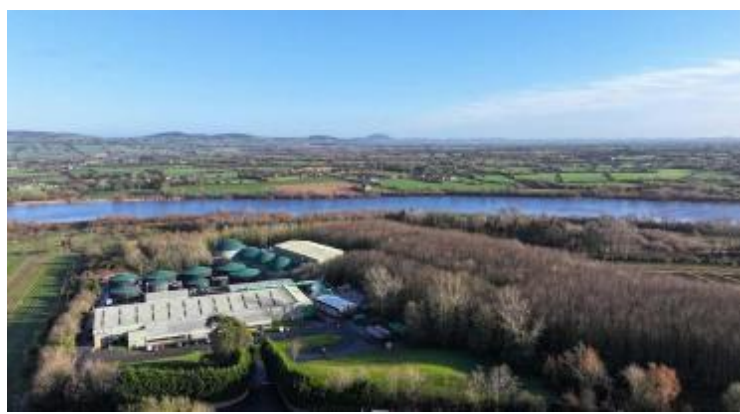
Naturgy entra en el capital de Recycle para desembarcar en la gestión de los residuos.

Membrilla, Bio Corral de Almaguer, Biogas Lucainena, Bio Loja, Bio Vilches y Bio Tobarra que han sido desarrollados por la castellanense Hispania Silva.